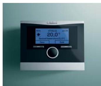
calorMATIC 370, 370 f