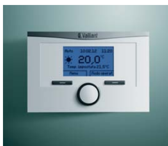
calorMATIC 332, 350, 350 f