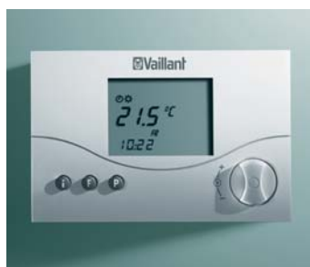
calorMATIC 340 f