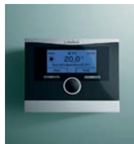
calorMATIC 470, 470 f