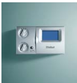
VRC 410 s