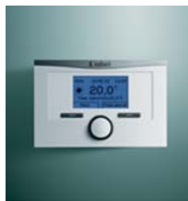
calorMATIC 450, 450 f