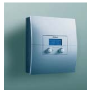
calorMATIC 630/3, auroMATIC 620/3